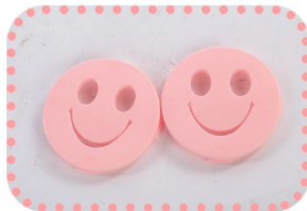
покрышки на переднее колесо